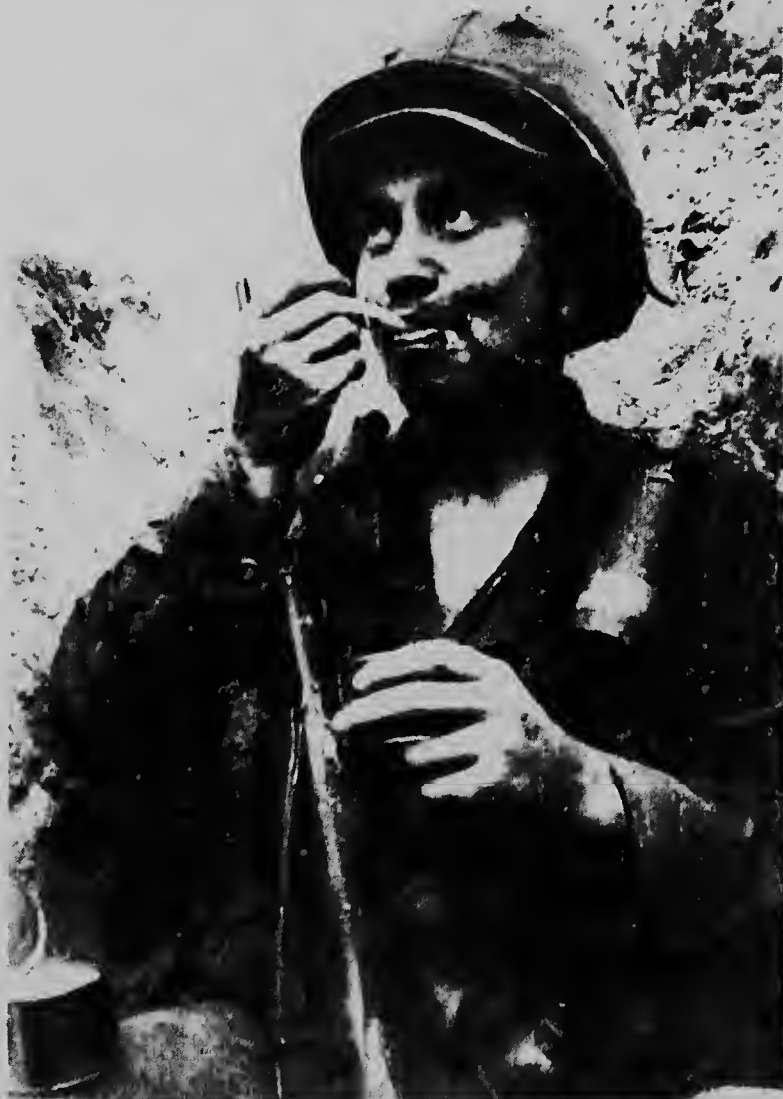
Zona di Guerra na Vietnam--Radiophoto UPI--Un di e soldanan mericanonan na Vietnam no tin tempo pa warda te ora cuminda ta cla y a dicidi di pasa su hamber poco riba un bleki di caminda, mientras e ta sinta na warda den un buracu.

E poeshi tabata un animal vilioso qu a costa 75 florin y a doña a tuma tur e molestia pasa e trabaunan administrativu pa trese e animal for di Hulanda.